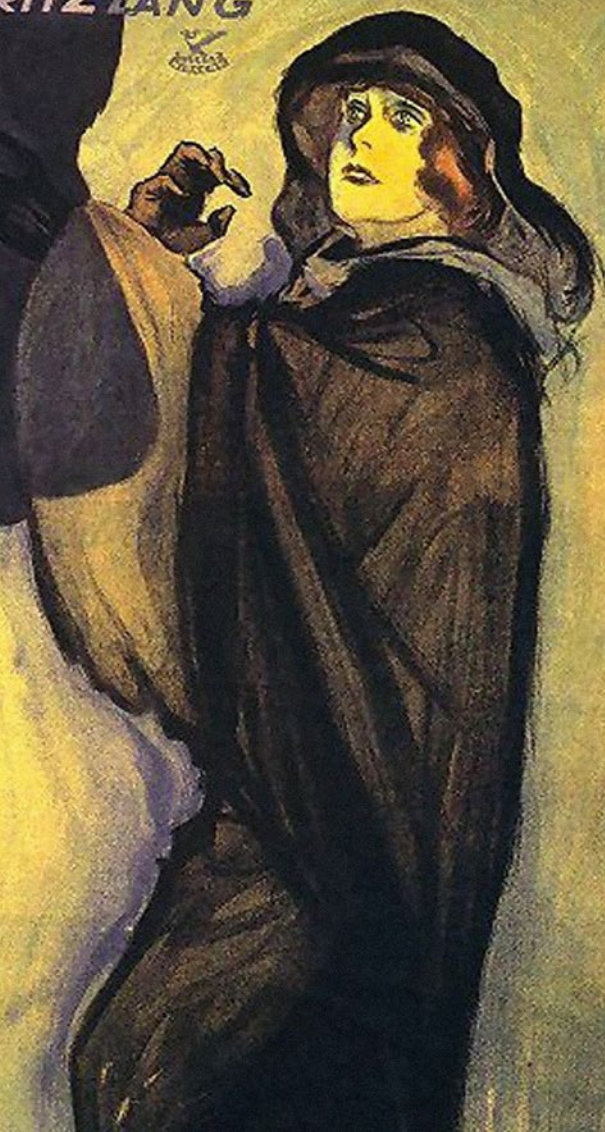
Il dottor Mabuse