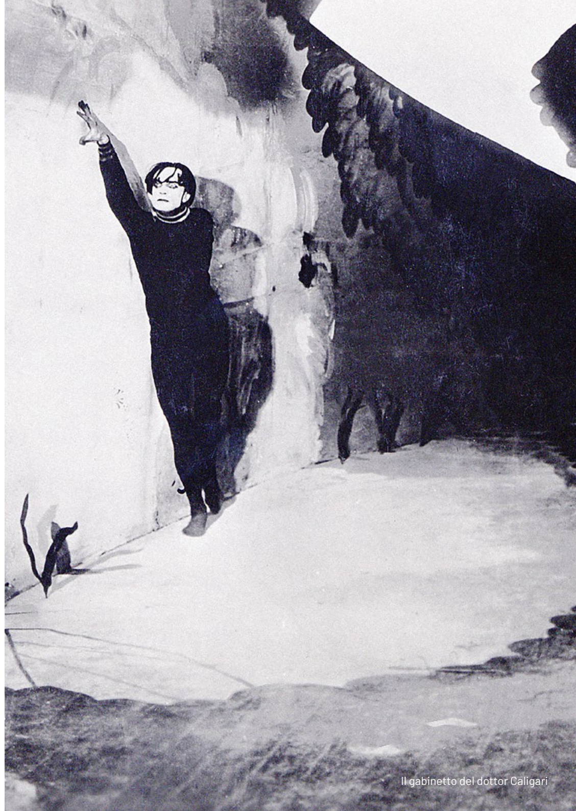
Il gabinetto del dottor Caligari